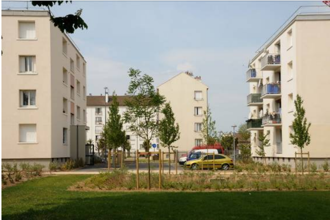
Bassin de récupération des eaux de pluie de la résidence