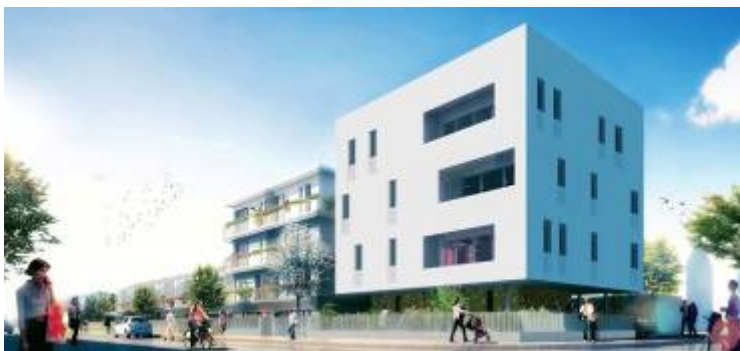
Architecte : Philippe Roux

Immobilière 3F livrera en 2012 , rue Léo Lagrange , une dernière opération de 28 logements sociaux dont 12 logements individuels.