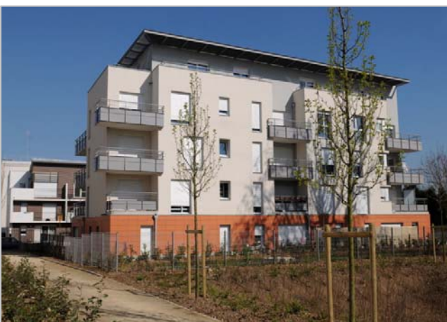
Architecte : Agence Laroche et Jard

- le 17 février, rue Maurice Bellonte , 19 logements sociaux (17 PLUS) et très sociaux (2 PLAI) qui bénéficient de la certification Habitat & Environnement, avec l'objectif Très Haute Performance Énergétique (THPE) 2005.