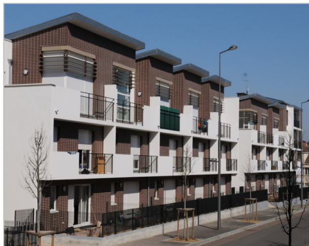
Architecte : Agence HB Architectes

- le 31 janvier dernier, rue des Frères Latuner , 28 logements sociaux (25 PLUS) et très sociaux (3 PLAI). Cette opération, constituée de 6 appartements et de 22 maisons de ville répondant aux exigences de la certification Habitat & Environnement avec l'objectif Très Haute Performance Énergétique (THPE) 2005.