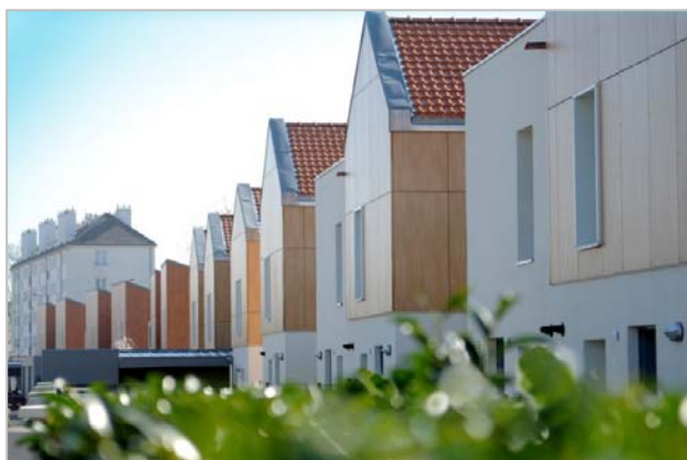
Architecte : Agence Bosom & Onate

- le 5 avril, rue Chateaubriand , 15 maisons individuelles (13 PLUS et 2 PLAI), dans le cadre d'un programme satisfaisant aux exigences de la certification Habitat & Environnement et à l'objectif énergétique Bâtiment Basse Consommation (BBC).