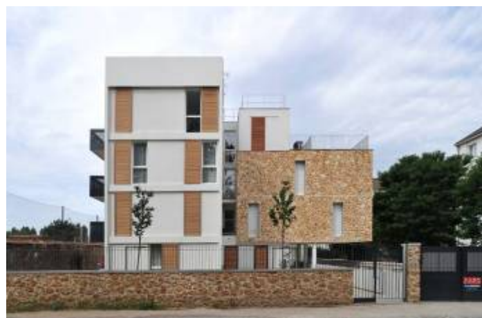
Architecte : MAP Architectes

La livraison de ces 62 logements, réalisés au sein de petits immeubles résidentiels, élégants et respectueux de l'environnement , a suivi celle d'un premier immeuble de 19 logements rue Gabriel Vilain , en 2009.