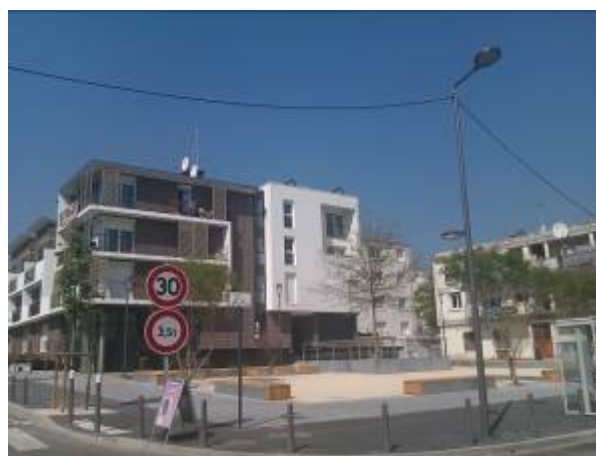
Place Aristide Briand