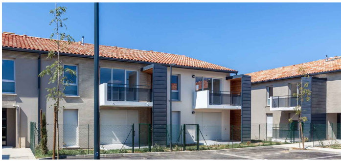
3F Occitanie (société de 3F/groupe Action

Logement) vient de livrer à Toulouse une résidence de 47 logements sociaux baptisée « Le Clos de la rive ». Elle prend place dans le quartier de Ginestous situé en bordure des rives de la Garonne et à 6 km du Capitole.