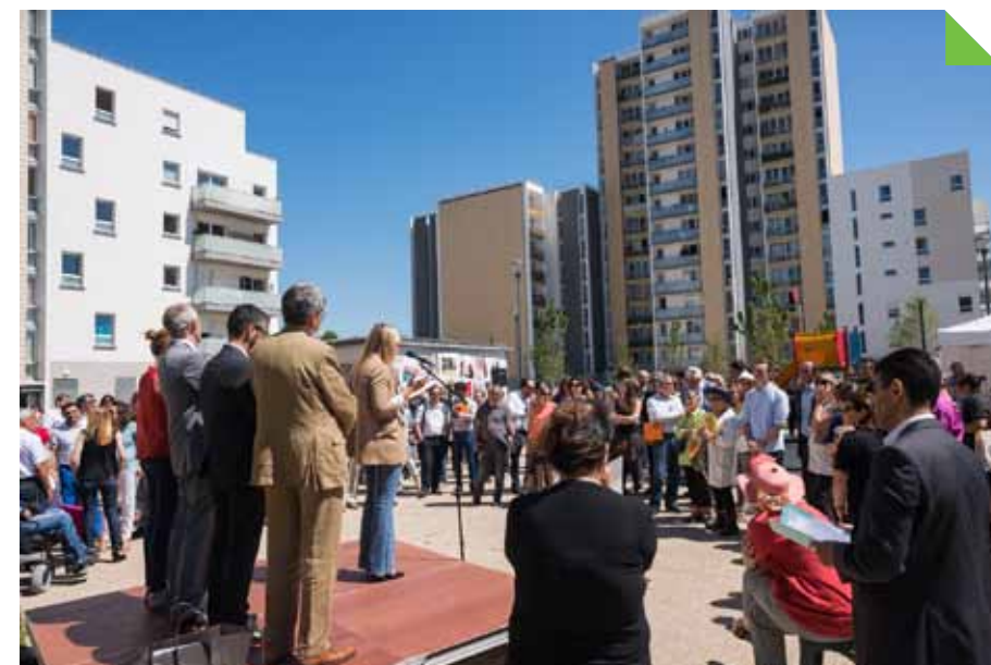
Une inauguration majeure pour la Cité-Rouge