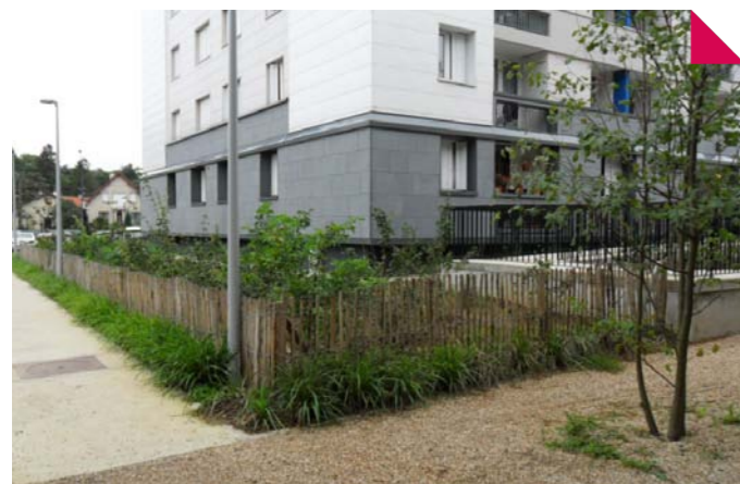
Nouvelles plantations en pied d'immeuble