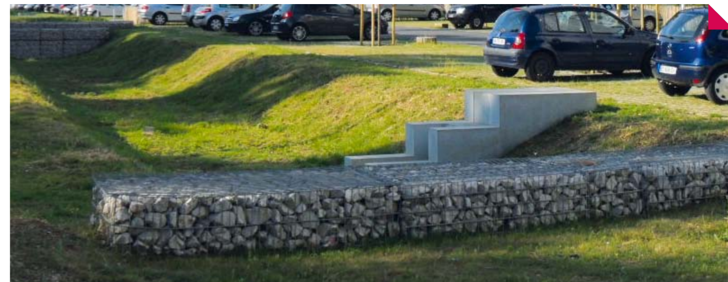
La noue située entre la résidence Bossuet et la route du Pavé-Blanc

Elles se remplissent lors de fortes pluies, et se vident soit par évaporation (soleil), soit par infiltration naturelle.