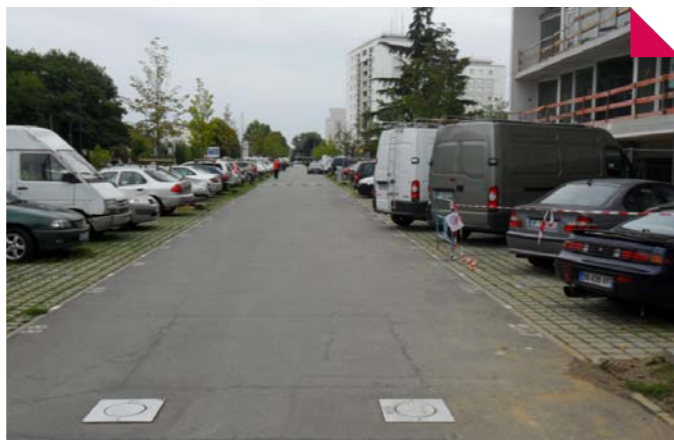
Parking de la contre-allée du Pavé-Blanc

Le traitement des espaces périphériques de la résidence (rue des Bosquets et rue Bossuet), et la mise en fonctionnement du contrôle d'accès des parkings pour la contre-allée du Pavé Blanc sont à ce jour impossibles. En accord avec les représentants des locataires, nous avons décidé de suspendre la mise en service de ce parking pour conserver, pour le moment, une poche de stationnement accessible à tous.