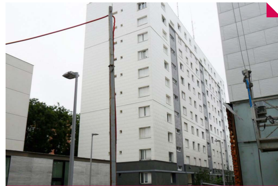
Ravalement pour le bâtiment A

L'intervention sur les façades du bâtiment A devrait s'achever cet été, celle du bâtiment B en fin d'année du fait d'une intervention rendue nécessaire sur les balcons.