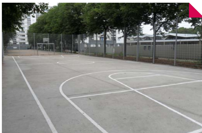
Nouveau terrain omnisport, rue Boileau