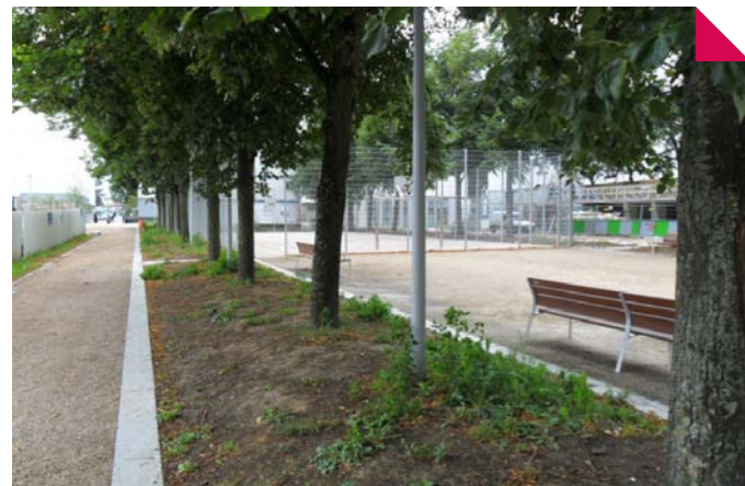
La rue Boileau devenue piétonne